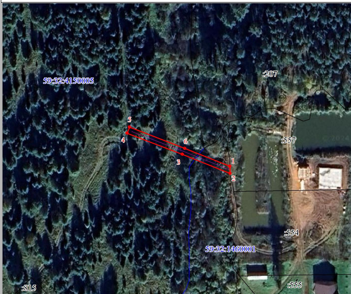
План границ объекта